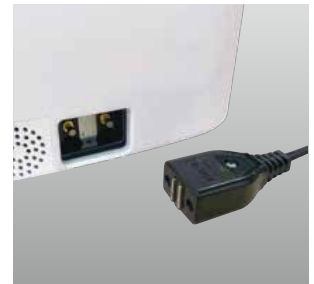
安心安全マグネットプラグ