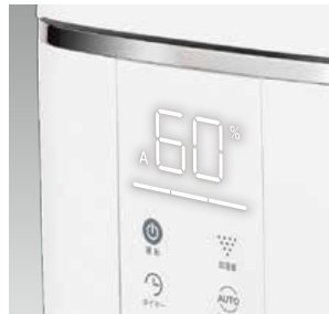
見やすいデジタル表示