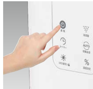
らくらくタッチ操作